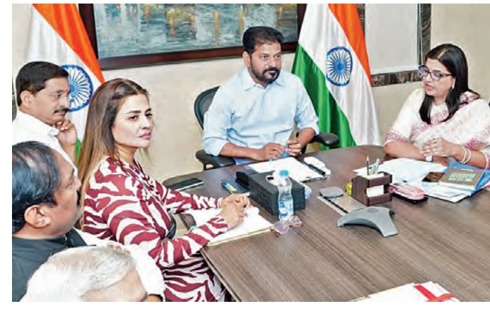
బుధవారం హైదరాబాద్ లో పలు కంపెనీల ప్రతినిధులతో సమావేశమైన ముఖ్యమంత్రి రేవంత్ రెడ్డి

భయేటర్లపై వివేచన పన్ను రద్దయిన ట్యాక్స్ సర్కార్ పునరుద్ధరణ? హైదరాబాద్, ఏప్రిల్ 8, ప్రభాతవార్త: రాష్ట్రంలోని సినిమా థియేటర్లలో ఎంటర్ టైన్ మెంట్ ట్యాక్స్ వసూలుకు రాష్ట్ర సర్కార్ నిర్ణయం తీసుకుంది. గత ప్రభుత్వం రద్దు చేసిన వివేచన పన్నును పునరుద్ధరించేందుకు ప్రస్తుత ప్రభుత్వం చర్యలు చేపట్టింది. రాష్ట్రంలోని అన్ని కార్నో రేషన్లు, మున్సిపాలిటీల్లో వివేచన పన్ను వసూలు >>2