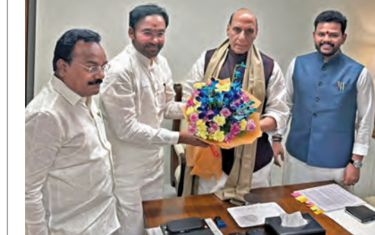
బుధవారం న్యూఢిల్లీలో రక్షణ మంత్రి రాజీనాథ్ తో భేటీ అయిన కేంద్రమంత్రులు కిషన్ రెడ్డి, రామ్మోహన్ నాయుడు

తెలిపారు. రాష్ట్రంలోని విద్యార్థుల సంఖ్యలో హైదరాబాద్ నగరంలోనే 44 శాతం ఉన్నారు, వారికి నాణ్యమైన విద్య అందించాలని భావించే మన అందరిపైన ఉండాలన్నారు. కంపెనీలు స్టానికంగా ఉన్న అన్ని మౌలిక వసతులను వినియోగించుకుంటున్నందున తమ సీఎన్ఆర్ నిధుల్లో ఎక్కువ మొత్తాన్ని అదే ప్రాంత అభివృద్ధికి కేటాయించాలన్నారు. సీఎన్ఆర్ నిధుల వినియోగంలో ఇప్పటి వరకు సరైన విధానం లేనందున తాము ఒక ప్రత్యేక ప్రధాన కార్యదర్శిని ఇందుకు నియమించామని సీఎం తెలిపారు. కంపెనీల ప్రతినిధుల ఆయనతో సమన్వయం చేసుకొని తమకు ఆసక్తి ఉన్న విద్యా, వైద్యం, జల వనరులు, నైపుణ్య శిక్షణ, వాహనత్య కట్టడాల పరిరక్షణ, అడవుల సంరక్షణ ఇలా దీనికైనా సీఎన్ఆర్ నిధులు వినియోగించవచ్చని సీఎం తెలిపారు. ఇప్పటికే రూ.50 కోట్లు, రాష్ట్ర ప్రాంత ప్రాంత రూ.50 కోట్లు, యశోద ఫౌండేషన్ రూ.10 కోట్లు విద్యార్థులకు కేటాయించేందుకు ముందుకు వచ్చాయని వారికి సీఎం అభినందనలు తెలిపారు. కంపెనీల ప్రతినిధులు స్పందిస్తూ >>2