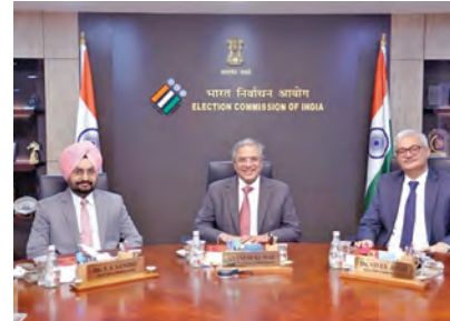
ఎన్నికల అధికారులను పటిష్టమైన బంధోబస్సు మద్దతి తరలింపారు. సమస్యాత్మక కేంద్రాలవద్ద కేంద్ర బలగాలను మొహరించేసారు. ఎక్కువగా ఈశాన్యరాష్ట్రం అస్సాంలోనే కేంద్ర బలగాల బంధోబస్సు ఎక్కువ ఉంది. ఈ రాష్ట్రంపై ఇతర పార్టీలను ఉన్న రాష్ట్రాల ప్రభావం ఎక్కువ కనిపిస్తుండటంతో కేంద్ర ఎన్నికల సంఘం అధికార పటిష్టమైన చర్యలు తీసుకుంది.

న్యూఢిల్లీ, ఏప్రిల్ 8: రెండు రాష్ట్రాలు, కేంద్రపాలిత ప్రాంతంలో గురువారంజరిగే పోలింగ్ కోసం ఏర్పాటు చేసింది ఎన్నికల యంత్రాంగం. కేరళంలో 140 స్థానాలు, అస్సాంలో 126 స్థానాలు, కేంద్రపాలితప్రాంతం పుదుచ్చేరిలో 30 స్థానాలకు గురువారం పోలింగ్ జరగనున్నది. ఎన్నికలకోసం కేరళలో సుమారు 40,771 పోలింగ్ కేంద్రాలు, పుదుచ్చేరిలో 1099 పోలింగ్ కేంద్రాలు ఏర్పాటుచేసారు. అస్సాంలో 126 స్థానాలకు 31,486 పోలింగ్ కేంద్రాలు ఏర్పాటుచేసారు. పోలింగ్ కేంద్రాలన్నింటిలోను వెబ్ సైట్ లో ఏర్పాటుచేసారు. ఓటర్ల తమతమ పోలింగ్ కేంద్రాలను ఆన్ లైన్ లో కూడా చెక్ చేసుకోవచ్చని ఎన్నికల సంఘం ప్రకటించింది. ఎమ్పిఎస్ డిపార్ట్ మెంట్ కు చెక్ చేసుకోవచ్చని సూచించింది. ప్రతి ఒక్కరూ ఓటు హక్కు వినియోగించుకోవాలని, రాజ్యాంగపరంగా సంక్షేమించిన ఓటుహక్కును విస్తరించడంలా ఎన్నికల యంత్రాంగం భారీ ఎత్తున ప్రచారం చేస్తోంది. ఈ ఎన్నికల్లో ఈసారి కేరళ, అస్సాం లలోనే పోటీ తీవ్రంగా ఉంటుంది. ముచ్చటగా మూడోసారి అస్సాంలో తన పట్టును నిరూపించుకునేందుకు బిజెపి ప్రయత్నిస్తుంటే కేరళలో ఎల్ ఐ డి అంటే ప్రస్తుత అధికార కూటమి వినయ విజయ సారథ్యంలోని ఎల్ ఐ డి పోలింగ్ పాలన పగలు చేపట్టేందుకు నిర్ణయం తీసుకుంది. ఎన్నికలకోసం సమగ్రంగా కేంద్ర బలగాలను కూడా ఈమూడు రాష్ట్రాలకు తరలింపారు. పుచ్చేరి కేంద్రపాలితప్రాంతంలో అయితే ప్రస్తుతం సిఎం ఎన్ ఆర్ రంగస్థాయి కూటమికి మళ్లీ పట్టు కట్టిట్టు ఓటర్ల నాడి ఉంది. బిజెపికి జనతా ప్రభుత్వం సడిమీ నంగతి తెలిసింది. అసోం కూడా అదే కూటమి పరిధిలో అధికార పగలు చేపట్టింది. రంగస్థాయి వ్యూహం అమలుచేస్తున్నారు. ఇదిలా ఉంటే పోలింగ్ కేంద్రాలకు ఈవీఎలతో పాటు సి బిఎం.